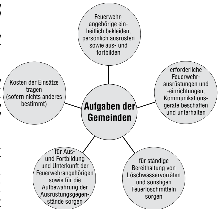
Grafik 1: Aufgaben der Gemeinden

Gemeinden können mit anderen Gemeinden Regelungen über die Zusammenarbeit ihrer Feuerwehren treffen. So kann in Alarm- und Ausrückeordnungen (AAO) festgelegt werden, dass bei einem bestimmten Alarmstichwort, z.B. „Dachstuhlbrand“, neben der örtlichen Feuerwehr sogleich eine Drehleiter der Nachbargemeinde parallel alarmiert wird.